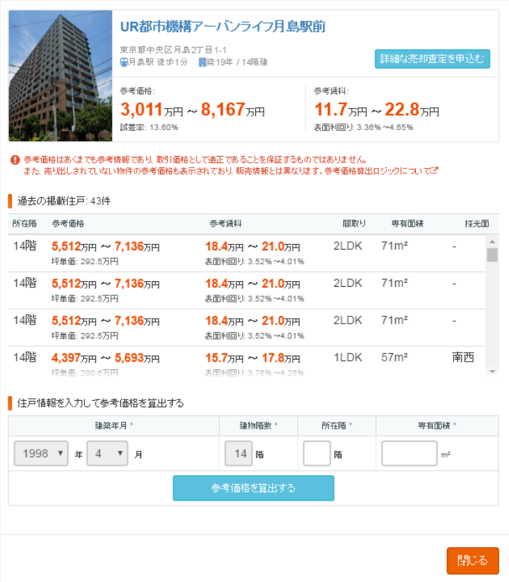
個別物件の表示例（過去の掲載住居の閲覧と、参考価格の査定が可能）