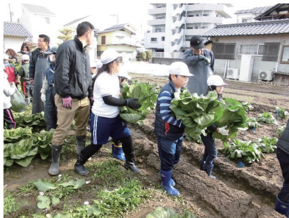
図-1 広島菜の収穫体験

このため、本市では、令和2年に生産緑地制度を導入し、令和2年に32地区5.8haを、令和3年に15地区2.2haをそれぞれ生産緑地地区に指定したところである。